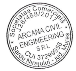
PLAN DE SITUATIE

BILANT TERITORIAL S total teren = 505 mp A construita existenta Ac = 74.60 mp A construita propusa Ac = 84 mp A desfasurata existenta AD = 107.40 mp A desfasurata propusa AD = 125 mp POT existent = 74.60 / 505 \times 100 = 15\% CUT existent = 107.40 / 505 = 0.21 POTpropus = 84 / 505 \times 100 = 16\% CUTpropus = 125 / 505 = 0.24